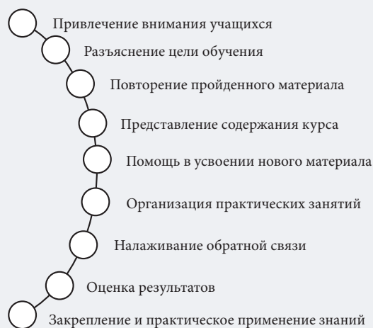
Рис. 4. Этапы обучения

Цели обучения формулировались таким образом, чтобы соотнести потребности целевых групп с 12 компетенциями. Далее приведены примеры из списка, составленного на основе их систематизации. В ходе этого