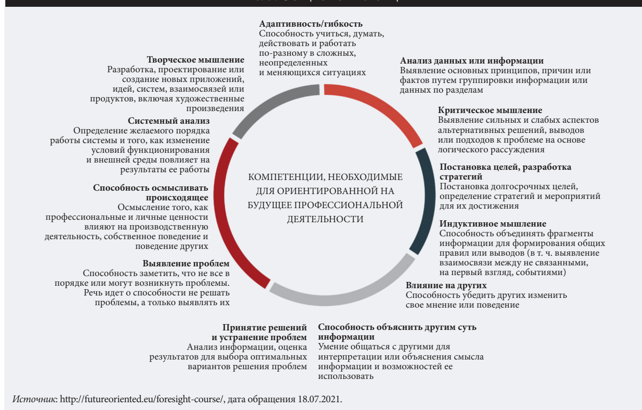
Рис. 3. Общие компетенции