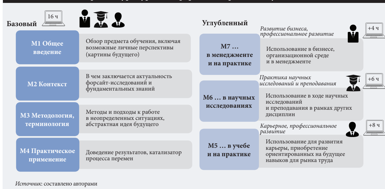
Рис. 5. Архитектура курса платформы электронного обучения beFORE

Все модули разделены на занятия, посвященные конкретным темам. Каждый модуль содержит программу самостоятельного обучения в соответствии с задачами учащегося. Можно выбрать модуль или занятие по интересующей теме в зависимости от персонального уровня, закрепить существующие знания или получать новые, углубленные. Предусмотрена возможность формировать индивидуальные траектории, выбирая контент по своему усмотрению. Их примеры представлены на онлайн-платформе и служат ориентирами 9 . Гибкая структура позволяет конструировать индивидуаль-