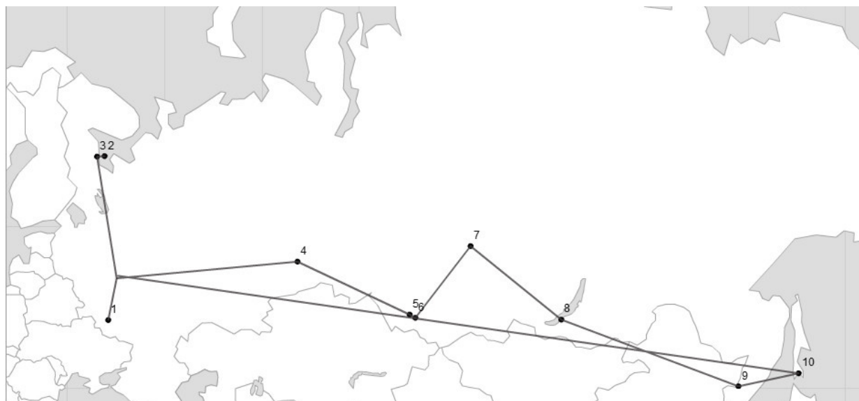
Figure 2. Monasteries Visited (1999–2004)