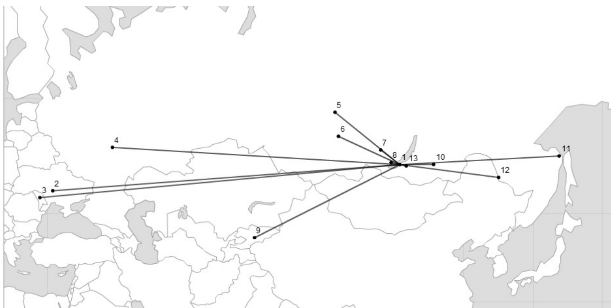
Figure 1. Territorial Representation of the Social Network in a Community of an Orthodox Monastery (Village of Posolskoe, Buryatia)

Observation objects were Orthodox male monasteries on the territory of three economic regions of Russia — Eastern Siberian, Western Siberian, and Far Eastern. The sample of monasteries was made from the list provided in book Monasteries of the Russian Orthodox Church. A Guidebook [2001] where the full list of Orthodox monasteries in post-Soviet Russia was given.